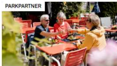
Genussreise entlang der Sagenroute Gantrisch