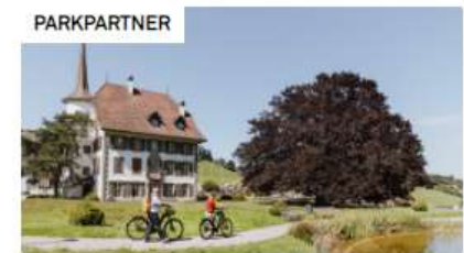
Sagenhafte Übernachtung im Schloss