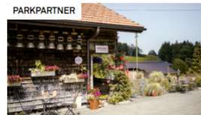
Sagenhafte Übernachtung auf dem Bauernhof