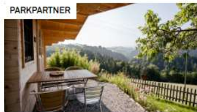
Sagenhafte Auszeit auf dem Biohof